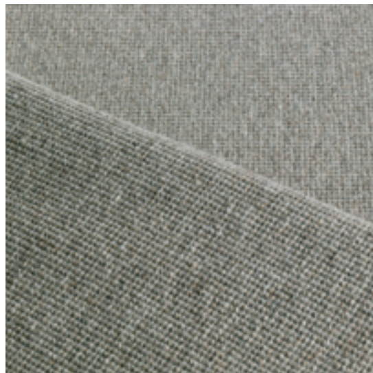
move - 3777 cashew