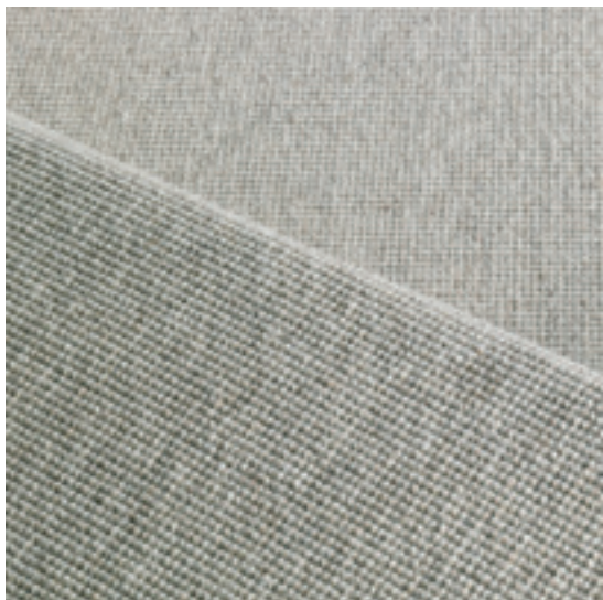
move - 3778 cornsilk