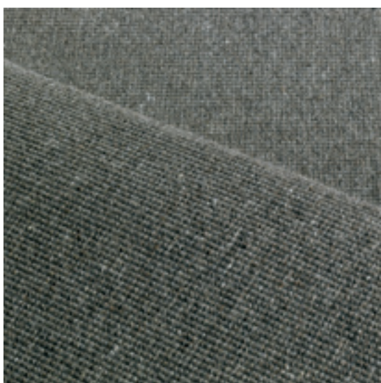
move - 3779 mushroom